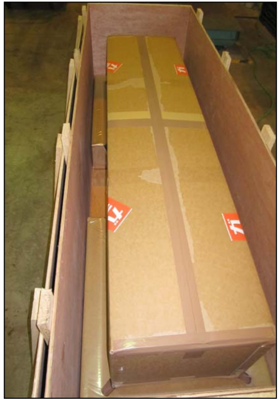
②製品をコーナー緩衝材にセット