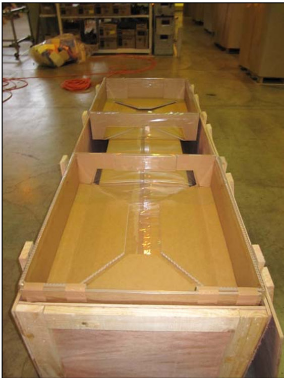
③天面用コーナー材を設置