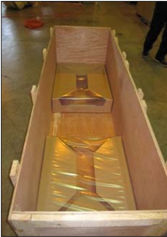
①コーナー緩衝材を底に設置