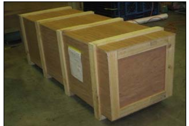
④蓋をして、梱包完了